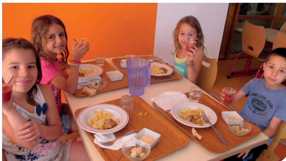
650 000 € d'investissement pour la cuisine centrale

En 2015, l'interco consacre 10 millions d'euros aux dépenses d'équipement, soit un investissement de 393,10 euros par habitant et par an.